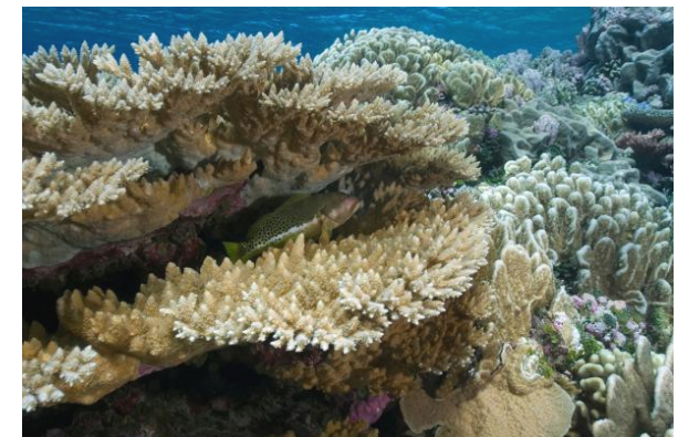
Corail mort récemment