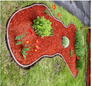
Exemple de plate-bande