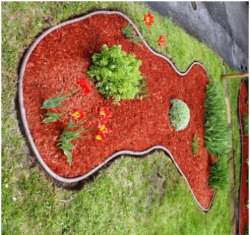
Exemple de plate-bande